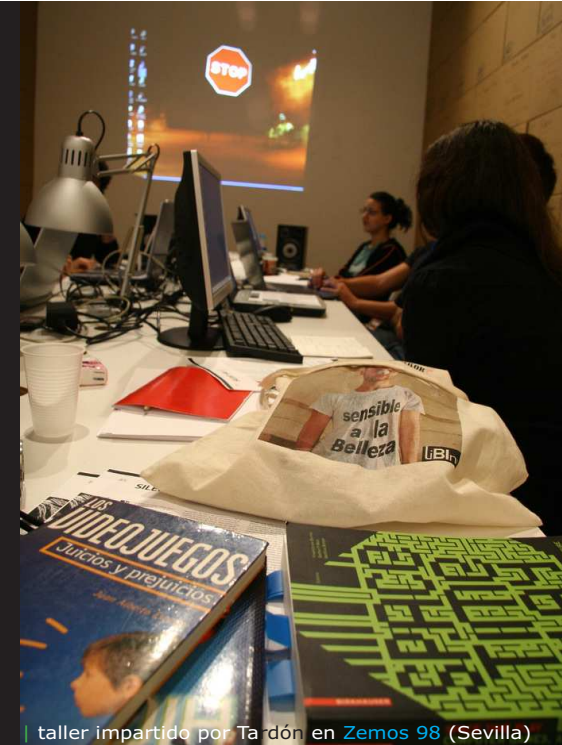
taller impartido por Tardón en Zemos 98 (Sevilla)